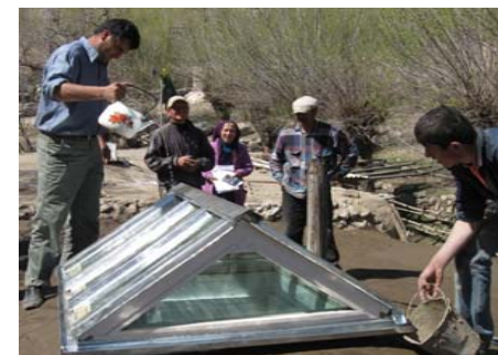
на фото: демонстрация преимуществ нового рудза для местных жителей