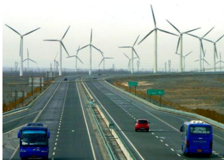
на фото: ветряная энергетика в Китае переживает бум

Закон «О возобновляемых источниках энергии» вместе с рядом сопутствующих подзаконных актов послужил сигналом к незамедлительному развитию предприятий в области энергии солнца, ветра и биомассы. Это также способствовало дальнейшему расширению малой