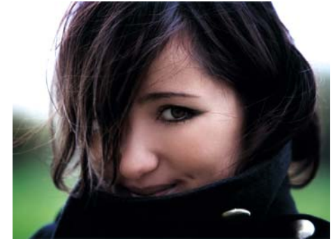
на фото: рок-певица КТ Тунсталл

Тунсталл часто говорит, что работа рок певицы не самая экологически-дружелюбная профессия, поэтому она старается уделять этому вопросу особое