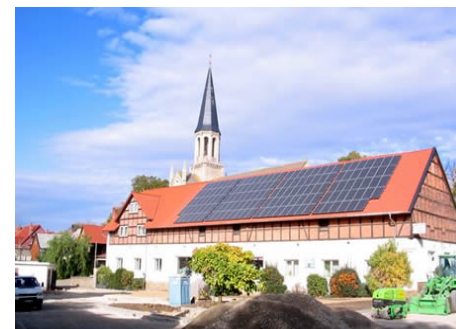
на фото: солнечные панели на крыше дома

Хорошая политика в области развития возобновляемых источников энергии должна иметь, по мнению правительства