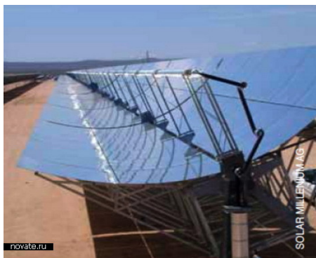
на фото: солнечная тепловая электростанция

Этот проект даст возможность постоянно получать чистую и безопасную энергию только с