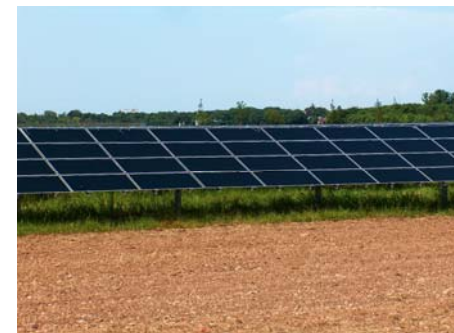
на фото: солнечная электростанция недалеко от Мюнхена, Германия

Это выгодно и для экономики. Средства, инвестированные в возобновляемую энергетику, способствуют снижению зависимости от импорта энергоисточников и растущих на них цен, и позволяют новым экологически-дружелюбным электростанциям сбивать цены на электричество, используя рыночные механизмы. Мы же продолжаем создавать благоприятные условия для развития этого сектора, прибыль которого только в 2007 году составила около 25 миллиардов Евро. Более того, в секторе возобновляемой энергетики занято около 250000 рабочих мест, в том числе и в восточной Германии, которая наиболее пострадала в связи со структурными изменениями в политике и экономике.