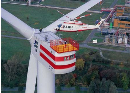
на фото: ветряк в северной Германии

производства электроэнергии из возобновляемых источников до 12,5%.