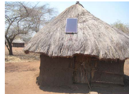
на фото: солнечная фотопанель на крыше обычного дома в Мозамбике

Для всех покупателей «ADEL-Sofala» предоставляет буклет с инструкцией по эксплуатации солнечных установок. По необходимости сотрудники организации также предоставляют технические консультации для