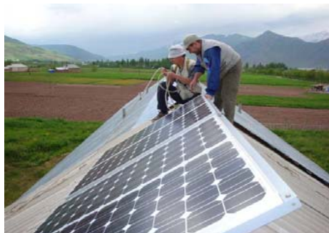
на фото: установка солнечных панелей на

«Мы использовали солнечные панели, вырабатывающие от 0,15 кВт до 0,35 кВт электроэнергии.