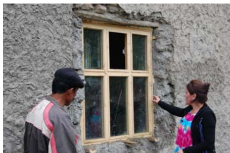
на фото: хозяйка дома рассматривает новые окна с двойным остеклением

На Памире большая часть населения региона проживает в традиционных памирских домах, которые обычно состоят из одной большой комнаты, где и располагается семья. Стены, пол и потолок практически не имеют теплоизоляции. Зачастую это каменные постройки, покрытые сверху слоем глины. Окна (если они есть) обычно представляют собой одинарное стекло или просто натянутый кусок полиэтилена. После развала Советского Союза уголь стал дорогим удовольствием и не многие семьи могли позволить себе его закупать. Жителям нужен был другой доступный источник энергии для приготовления еды и отопления домов. Сегодня основным видом топлива для